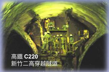
高鐵 C220 新竹二高穿越隧道